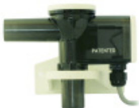
60080 Conductivity Sensor Assembly