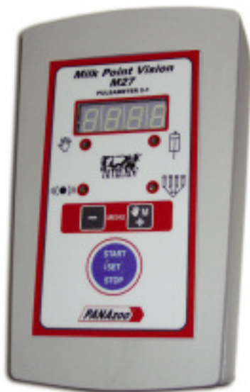
60027P M27 MILK METER